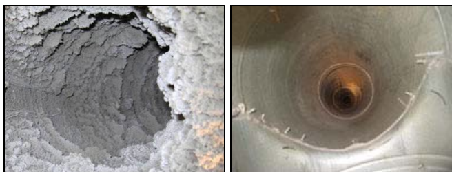
Eksempel på tilsmudset ventilationskanal før og efter den er rensset.

Regelmæssig rensning af kundens ventilationsanlæg reducerer risikoen for brandfare fra støv, der antændes. Det nedsætter samtidig risikoen for et dårligt indeklima, der kan medføre allergi, hovedpine og træthed hos medarbejderne. Og der er også mange penge at spare. Et snavset ventilationsanlæg bruger langt mere energi end et rent. SSG kan hjælpe dig med hurtig og effektiv rensning af kundens ventilationskanaler.