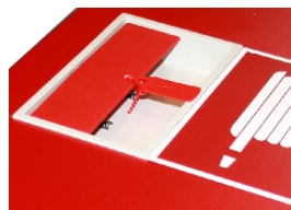
Lukketøj med hul til plombe